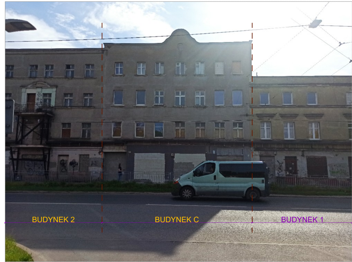
Widok od strony północno - wschodniej - frontowej