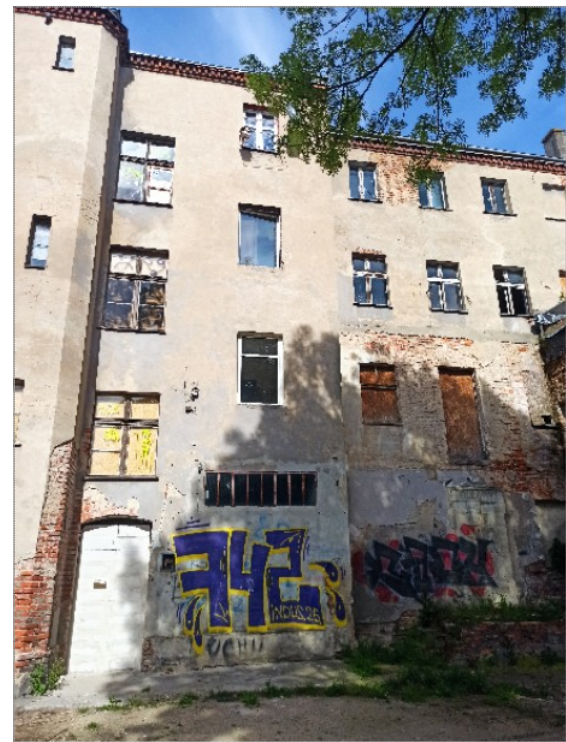
Widok od strony południowej